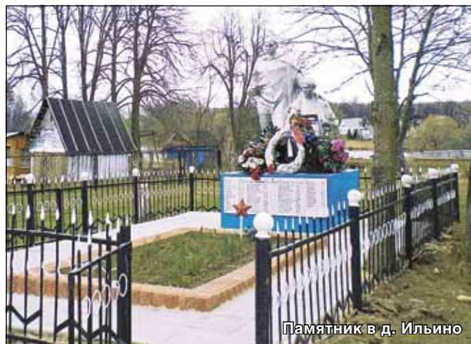
Памятник в д. Ильино