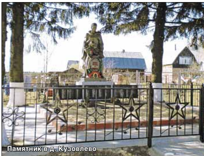
Памятник в д. Кузовлево

На роговской земле отношение к истории Отечества особенное. Здесь произошли два великих сражения: войны 1812 года и Второй мировой. Именно тут, на подступах к Москве, в грозном 1941-м было положено начало Великой Победы. О героизме и мужестве защитников нашей Родины ярче всего говорят 8 братских захоронений и памятные знаки, установленные на местах бывших сражений. В основном все памятники были построены в 50-е годы на средства шефских организаций – заводов гг. Подольска и Климовска. Но экономическое состояние многих из них не позволяет сегодня шефствовать, как в былые времена.