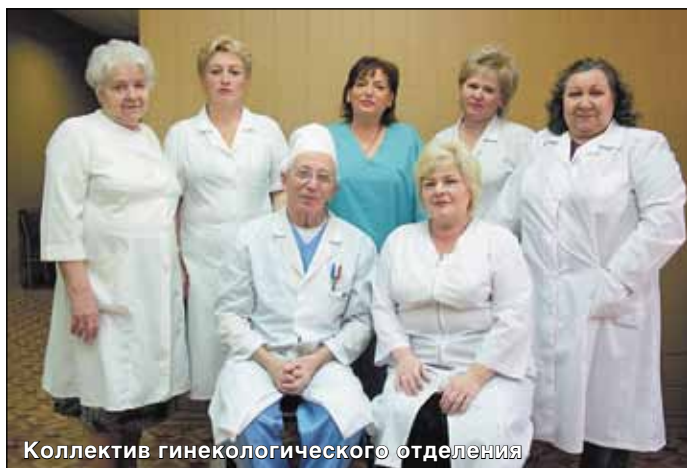
Коллектив гинекологического отделения

Правда, пока удаётся удерживать показатели по предпринимательской деятельности. На 90% они оказываются предприятиям, с которыми мы заключаем договоры, проводим медицинские осмотры их сотрудников. Это существенное финансовое подспорье для лечебного учреждения. Когда совсем недавно вышел приказ Минздрава об аннулировании в медицине платных услуг, все поликлиники и больницы серьезно встревожились. Хорошо, что этот приказ просуществовал всего один месяц и его тут же отменили.