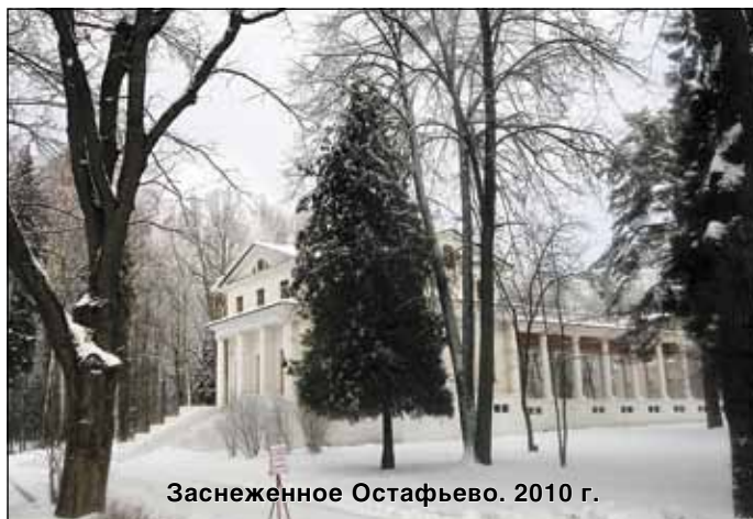
Заснеженное Остафьево. 2010 г.

К сожалению, Александрина, как называет ее Волконская в своих записках, прожила в Сибири недолго. В 1832 году