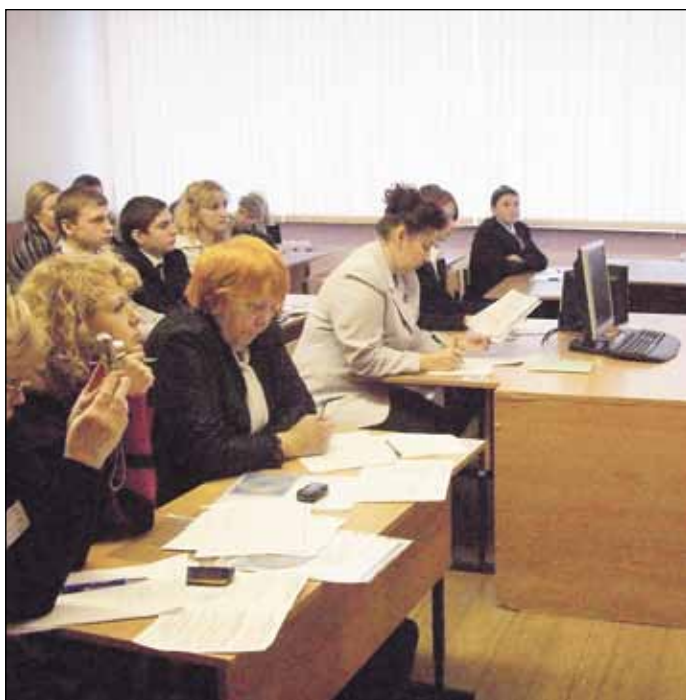
«Топонимика и легенды Подолья» – так называлась IV научно-практическая конференция учителей-словесников и учащихся Подольского района, прошедшая в последний день осени.

памятники, чем берестяная грамота, рукописная книга или редкий предмет, обнаруженный при археологических раскопках.