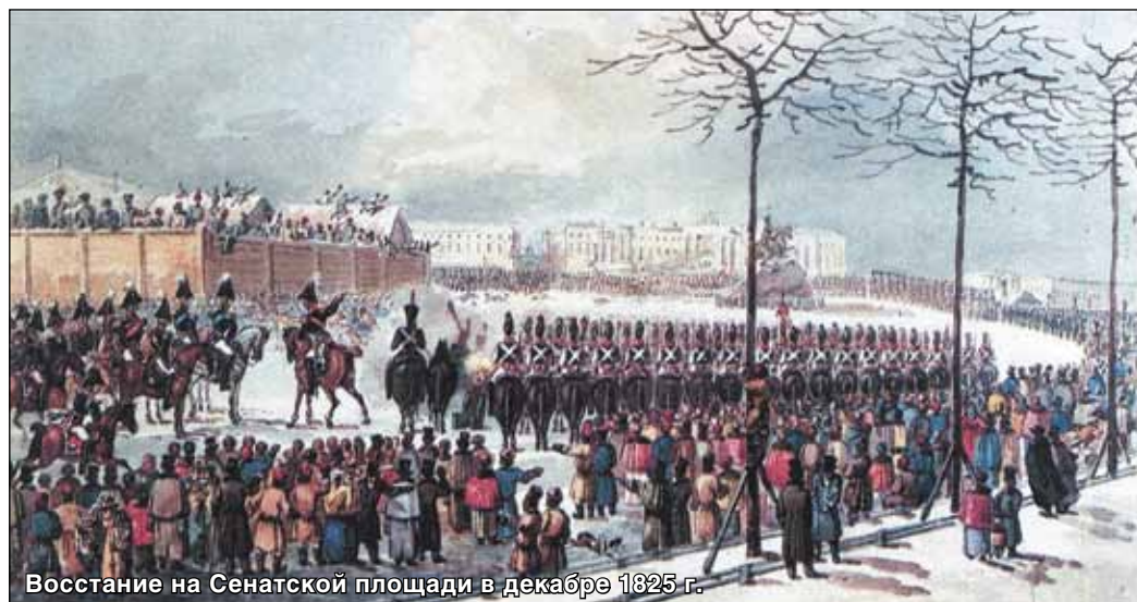
Восстание на Сенатской площади в декабре 1825 г.