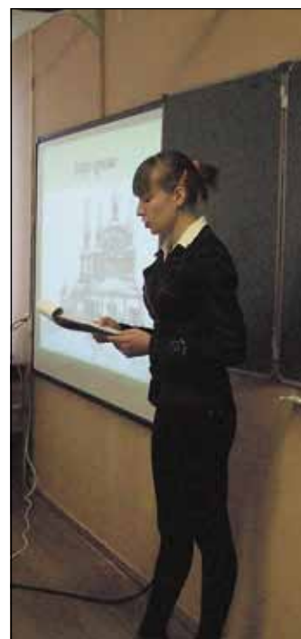
Строгое жюри буквально тереялось в присуждении призовых мест. Почти в каждой ученической работе был научный подход к теме, а в

Вторая часть конференции – это работа секций