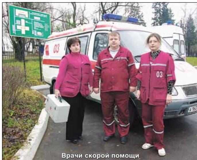
Врачи скорой помощи

высокотехнологичное оборудование потребовало длительной и тщательной наладки, отработки, подготовки кадров и весьма квалифицированного обслуживания в дальнейшем. Томограф работает уже 14 лет, в этом году в нем заменили блок электроники и программное обеспечение. Долгое время наличие томографа считалось «визитной карточкой» нашего учреждения в области, так как такая техника имела еще только в лечебном учреждении города Ногинска. Остальные подмосковные регионы могли о данном виде диагностики только мечтать или пользоваться услугами столичных клиник.