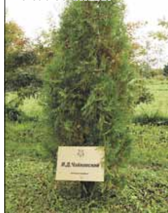
Именное дерево на аллее Славы