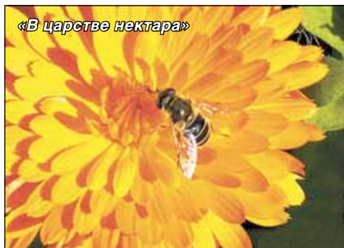
«В царстве нектара»