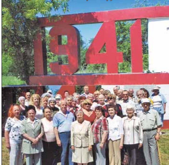
Делегация ветеранов на Нарском рубеже