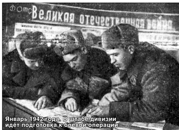
Январь 1942 года. В штабе дивизии идёт подготовка к боевой операции